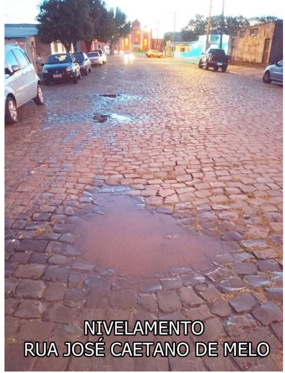
NIVELAMENTO RUA JOSÉ CAETANO DE MELO