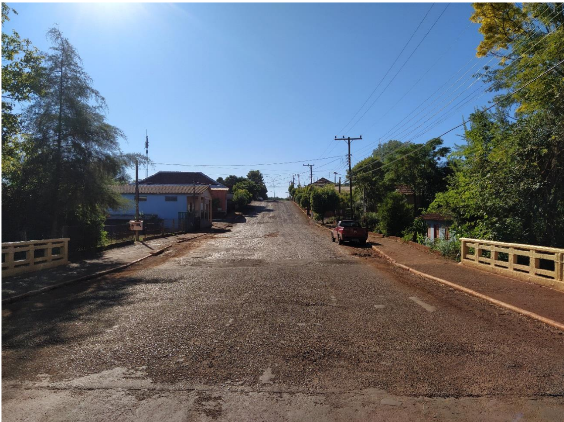
Figura 1 – Visual da área de intervenção vista a partir da ponte sobre o Lajeado Engenho em direção oeste.

Uma vez que trata-se de obra de capeamento asfáltico a Rua Celeste Rolim já apresenta seu traçado definido com meio-fio de concreto e possui pavimentação de calçamento de pedras irregulares de basalto. Existem deformações elásticas no pavimento ocasionadas pelo tráfego ao longo dos anos, as quais serão corrigidas às expensas do proponente, assim como já feito nas demais obras de capeamento asfáltico executadas através de Contratos de Repasse. A rede de drenagem existe parcialmente e será complementada pelo proponente até o início das obras através de equipe própria da Secretaria de Obras, que atua rotineiramente nestes serviços. A rede de distribuição de energia e telecomunicação ocupa a face sul da área de intervenção e não será necessária intervenção na mesma.