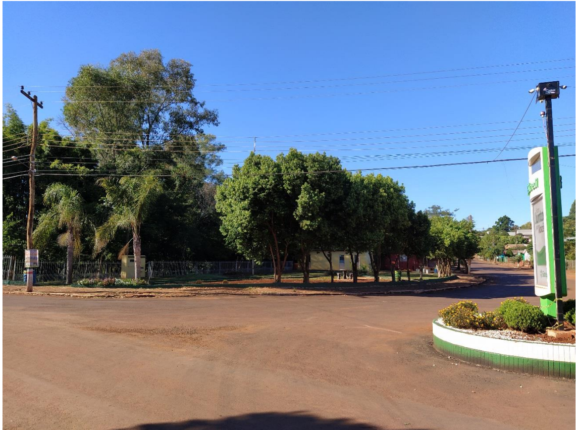
Figura 2 – Centro de Eventos. Fotografia capturada em 16/04/2020.

Não existem elementos naturais relevantes na área de intervenção, uma vez que se trata de rua com ocupação consolidada há décadas. Os acessos são vias urbanas pavimentadas com CBUQ ou calçamento de pedras irregulares de basalto. Quanto à presença de equipamentos públicos existe junto à área de intervenção o Centro de Eventos do Município de Inhacorá, localizado na interseção da Rua Napoleão Moreira Bueno com Rua Celeste Rolim de Moura, que encontra-se representado na Figura 3 .