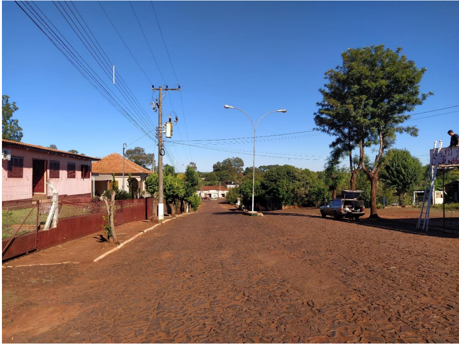
Figura 7 – Visual de Rua Celeste Rolim de Moura, da interseção com a Rua Fernandes Gomes vista em direção leste. Fotografia capturada em 16/04/2020.