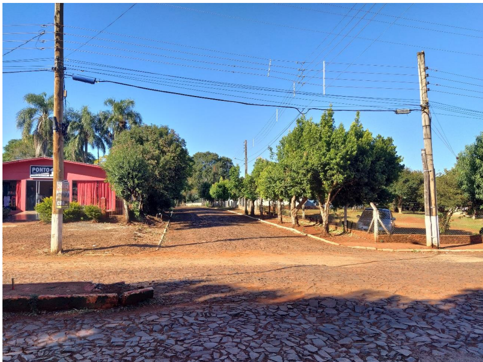
Figura 5 – Rua Fernandes Gomes, interseção com Rua Celeste Rolim de Moura. Fotografia capturada em 16/04/2020.