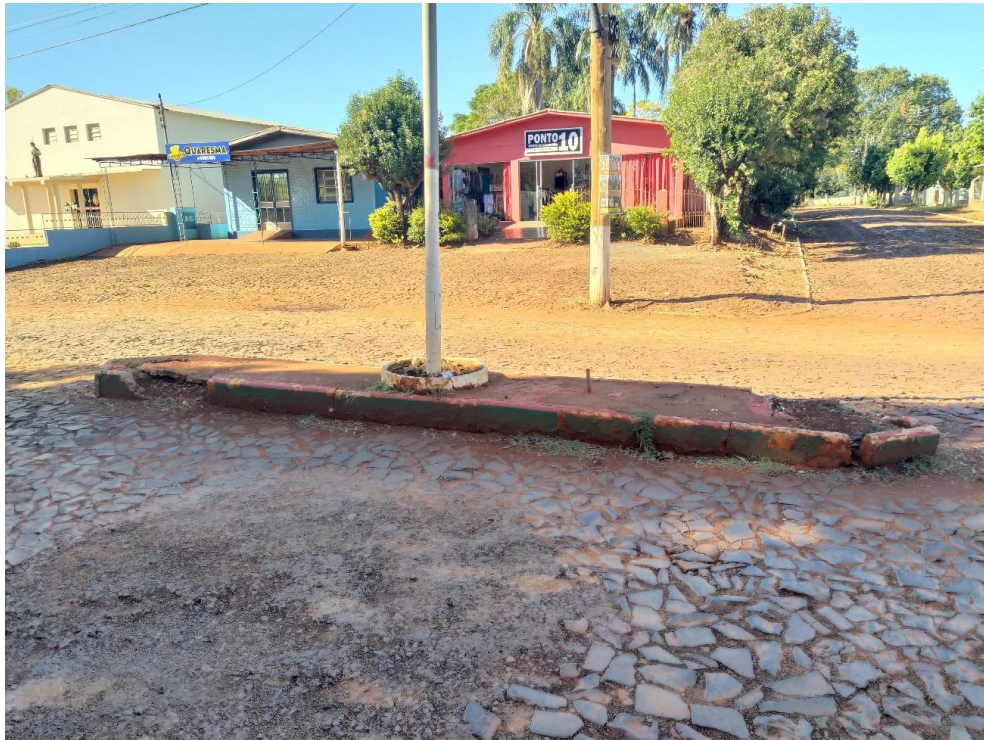
Figura 4 – Canteiro central a ser removido. Fotografia capturada em 16/04/2020.

Atualmente existe canteiro central com postes de iluminação, os quais serão removidos, seguindo diretriz da administração municipal, que está removendo os canteiros conforme ocorrem as obras de capeamento asfáltico.