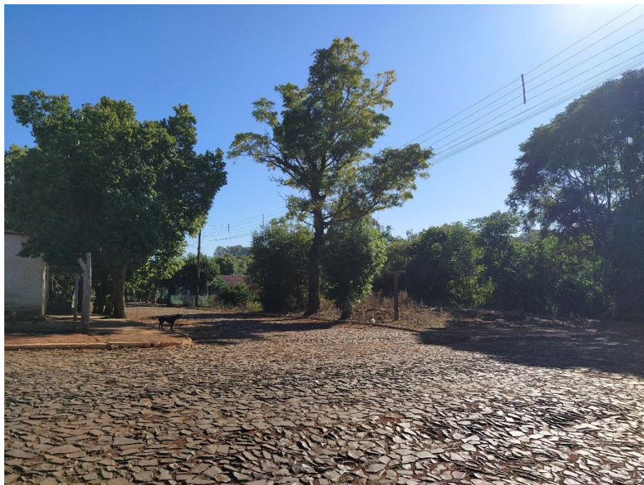
Figura 6 – Visual da interseção da Rua Hemagoras Rolim com Rua Celeste Rolim de Moura. Fotografia capturada em 16/04/2020.