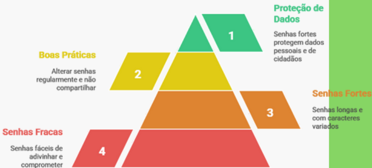
Pirâmide de Segurança de Senhas

👉 Uma senha forte protege não só você, mas também dados de cidadãos.